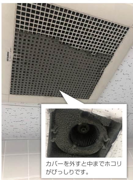
カバーを外すと中までホコリがびっしりです。