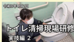
トイレ清掃現場研修 実技編 2