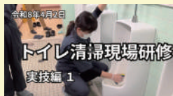
トイレ清掃現場研修 実技編 1